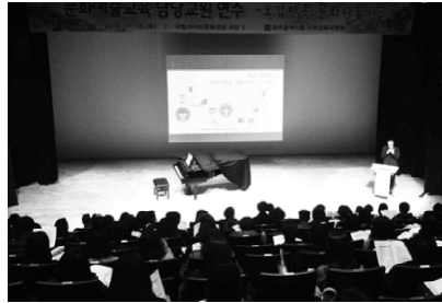
아시아 문화 중심도시의 명색에 맞는 광주교육을 일구어 나가기 위해 문화 예술교육활성화 사업을 적극 추진해 나갈 방침이다. 조만경 기자 jmc@