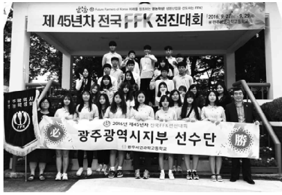
“대회를 준비하고 진행되는 과정에서 여러 어려움이 있었지만 서로 도와가며 다들 없이 지내는 모습에 뿌듯했다”며 “포기하지 않고 여러 사람