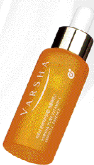
바르샤 퓨어비타민 C 앰플에센스 VARSHA PURE VITAMIN C AMPOULE ESSENCE 30ml

피부감동 프리미엄케어 고품격 항산화 피부를 위한 올바른 스킨케어의 첫단계 바르샤 퓨어비타민 두가지만으로도 기초케어, 완벽하게.