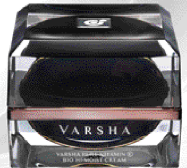
VARSHA PURE VITAMIN