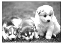
[연재] 반려견(애완견) 길들이기