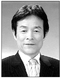
권진수 인천광역시 교육감권한대행

사랑하는 학생 여러분, 친애하는 인천 교육가족 여러분, 그리고 존경하는 인천시민 여러분! 새로운 선택과 도약을 향한 경인년(庚寅年) 새아침이 밝았습니다. 희망찬 새해를 맞이하여 인천시민과 교육가족 여러분의 가정에 건강과 행복이 가득하시기를 기원하며, 우리 인천교육에도 희망 가득한 기쁨이 넘쳐나는 2010년이 되기를 소망합니다. 지난 해 인천교육 발전을 위하여 관심과 성원을 아끼지 않으신 280만 시민 여러분과 교육가족 여러분께 진심으로 감사드리며, 목표를 실현하기 위해 학업에 정진