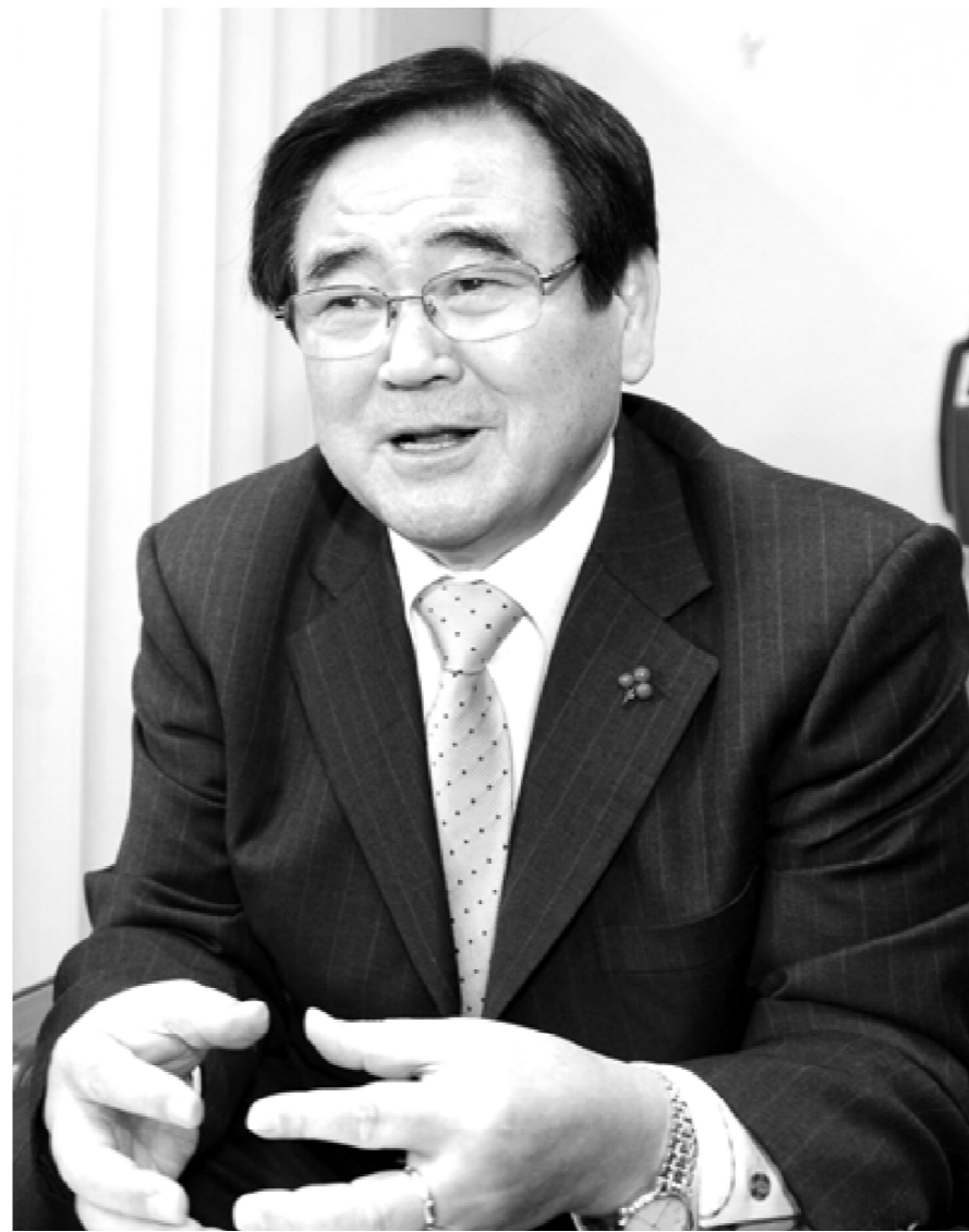
◆ 안순일 광주광역시 교육감

EBSe 교육방송 활용, 수준별 이등수업 확대, 교과교실제 운영 등을 통해 수준별 맞춤형 교육에 힘써 사교육비를 경감하고, 방과후학교와 사교육없는 학교 운영 등으로 교육과 돌봄(Edu-care)의 기능을 확대하는 한편, 유아교육진흥원과 공립특수학교 설립 추진, 특수교육지원센터 운영 등 교육 소외계층에 대한 교육 기회 확대와 복지 향상에도 소홀함이 없도록 할 계획입니다.