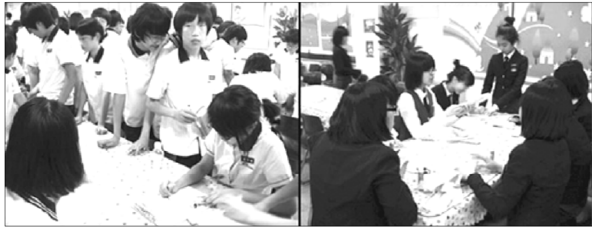
◆ 인천구산중 도서부 동아리 회원들의 활동이 활발하다.

에 대해서는 시정명령을 내렸다. 또 보험 배상기준 미달 및 학원 수감료 미표시로 적발된 7개 학원에 대해서는 모두 330만원의 과태료를 부과했다. 도교육청 관계자는 “기숙학원의 불법, 편법 운영으로 인한 수험생 및 학부모의 피해를 예방하고 학원 내에서 발생할 수 있는 사고를 사전에 방지하고자 특별 지도·점검을 실시했다”라고 말하며 “앞으로도 지속적인 지도·점검을 실시해 건전하고 안전한 기숙학원 운영을 위해 노력하겠다”고 전했다. 김래성 기자 kls@eduyonhap.com