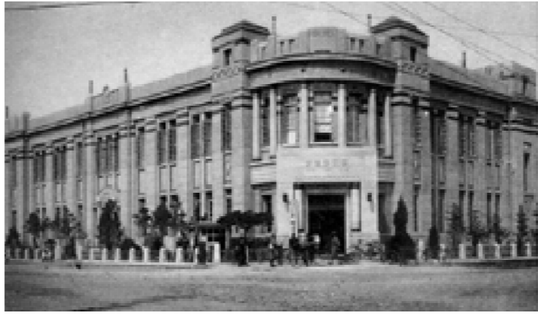
◆ 인천 우편국의 과거(사진 왼쪽)와 현재(사진 오른쪽)